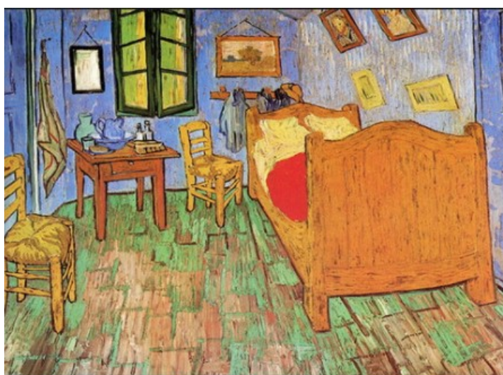
Quarto em Arles – Vincent Van Gogh